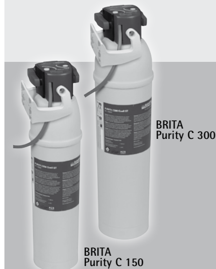
BRITA Purity C 300