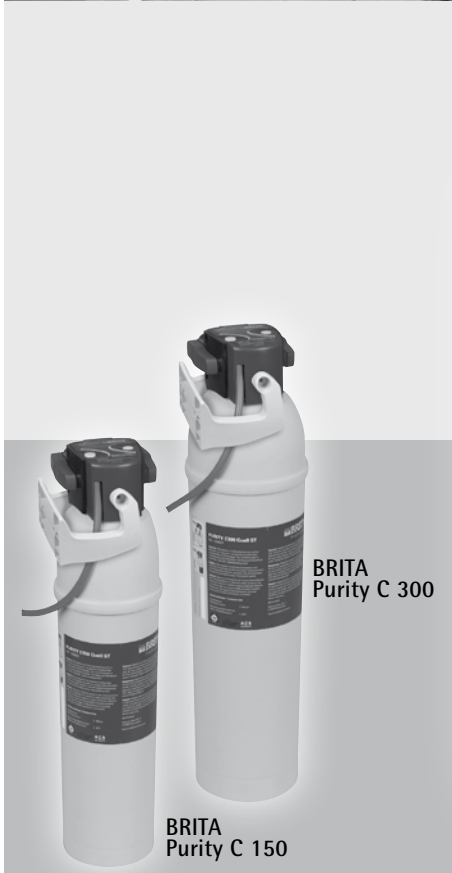
BRITA Purity C 300