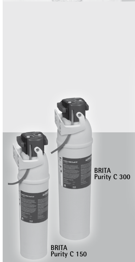
BRITA Purity C 300